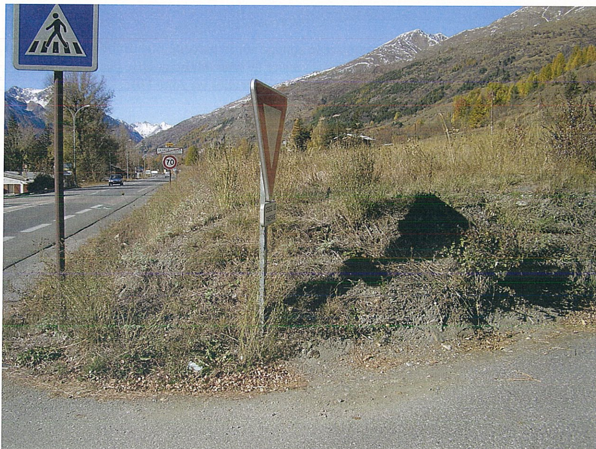
Emplacements réservés 15 et 16

Sur les emplacements réservés 15 et 16 la programmation du projet, la fixation du prix, certainement après consultation de France Domaine, incombe à la municipalité.