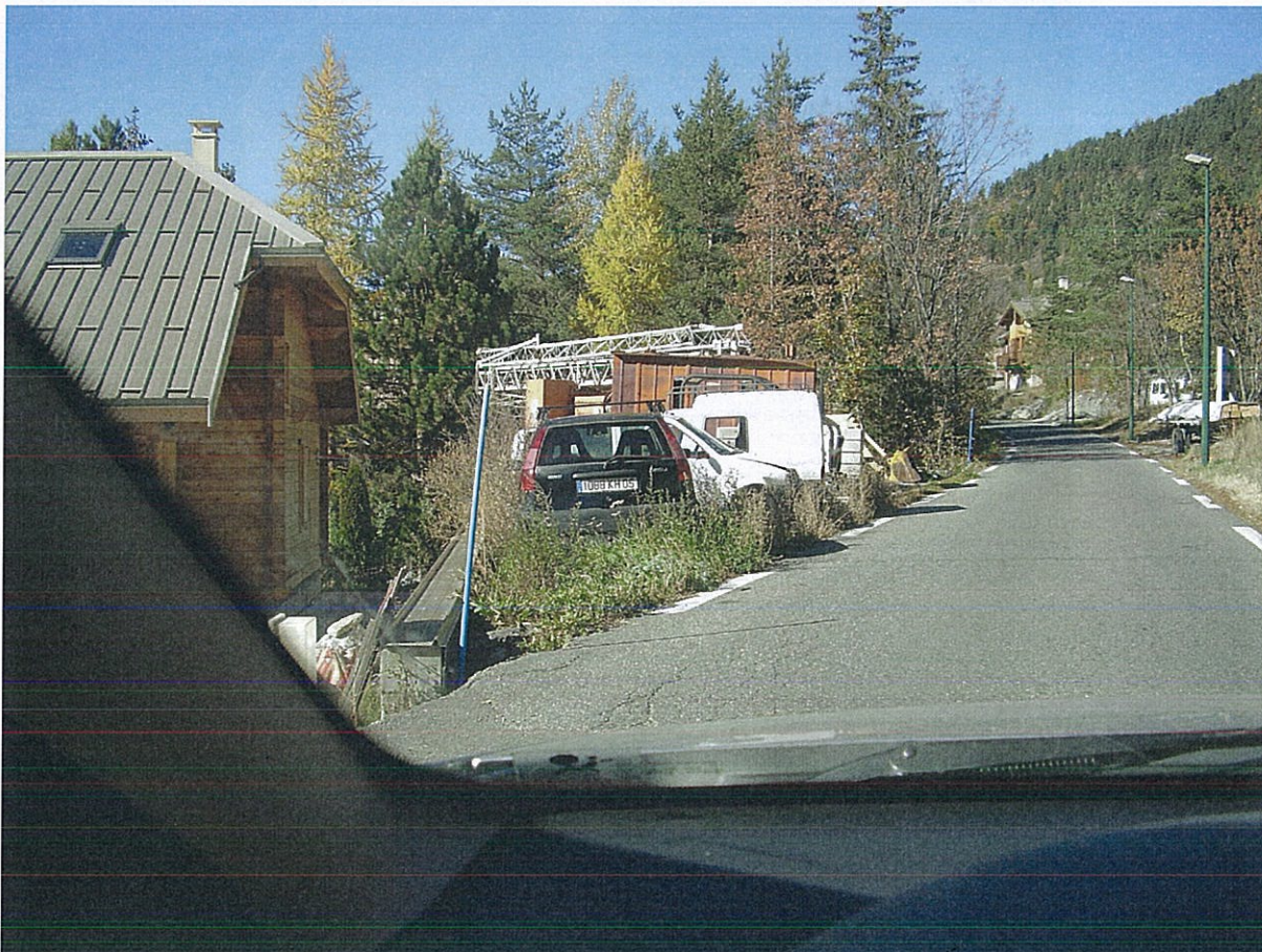
Route de la Chirouze, emplacement réservé N° 9.

Si l'aire de retournement me semble judicieuse, il m'apparaît dommage d'élargir cette voie des deux côtés.