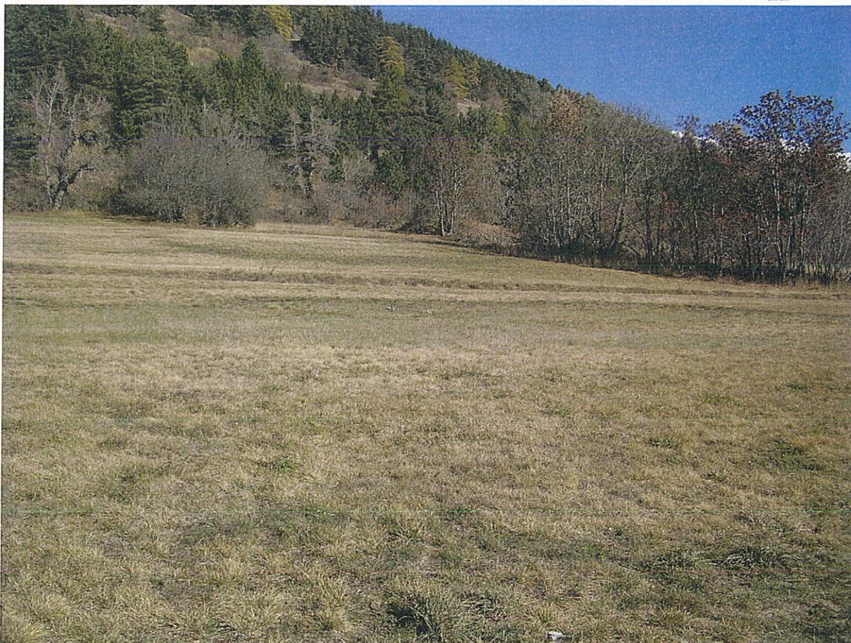
Le Clapier Long zone AU