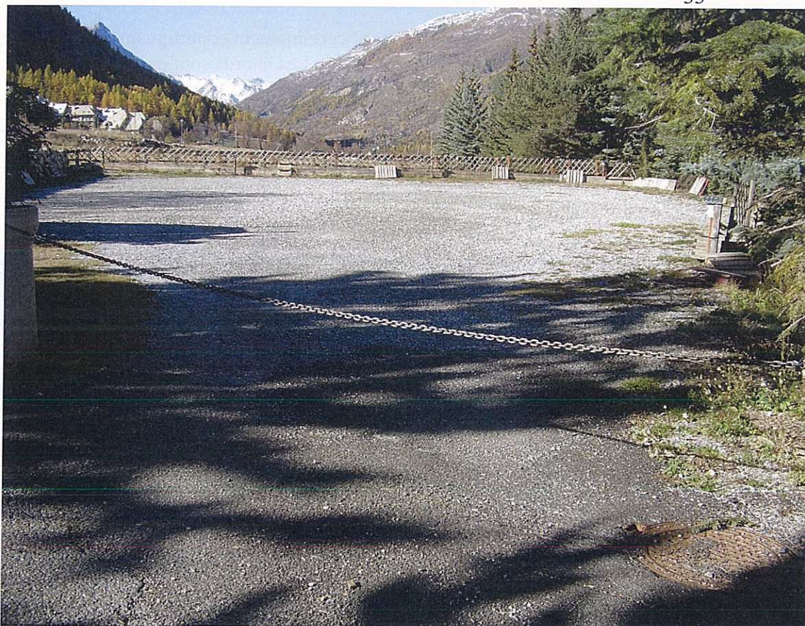
Emplacement réservé n° 19. Parking souterrain.

Avis : En fonction des autorisations d'occupation des sols délivrées, je propose de mettre en place une convention liant la commune et les propriétaires sur la restitution des parcelles après travaux. OU échanges de terrains dans le même secteur.